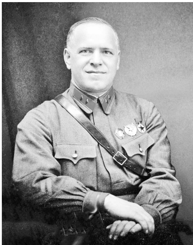
Командующий Западным фронтом Георгий Жуков.

Во время войны Думиничский район был оккупирован фашистами 5 октября 1941 года. Уже через месяц началось советское контрнаступление. 10-я армия, двигаясь в направлении Плавск – Белёв – Козельск – Сухиничи – Киров, в период с 4 по 11 января 1942 года полностью освободила территорию Думиничского района.